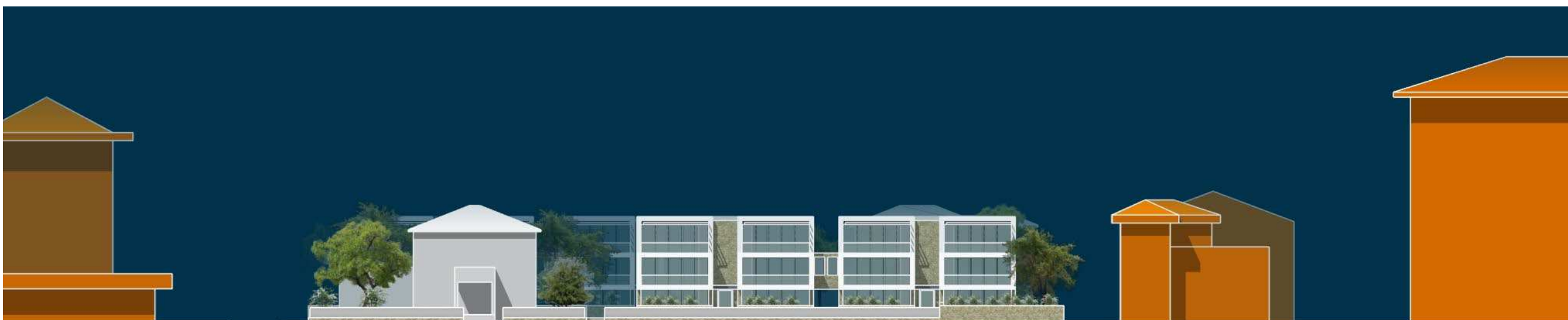
PROSPETTO DI PROGETTO SU VIALE CARDUCCI