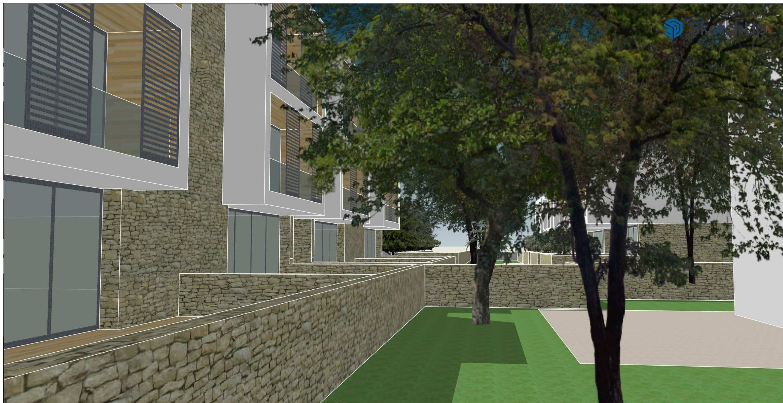
VISTA DELLA CORTE INTERNA