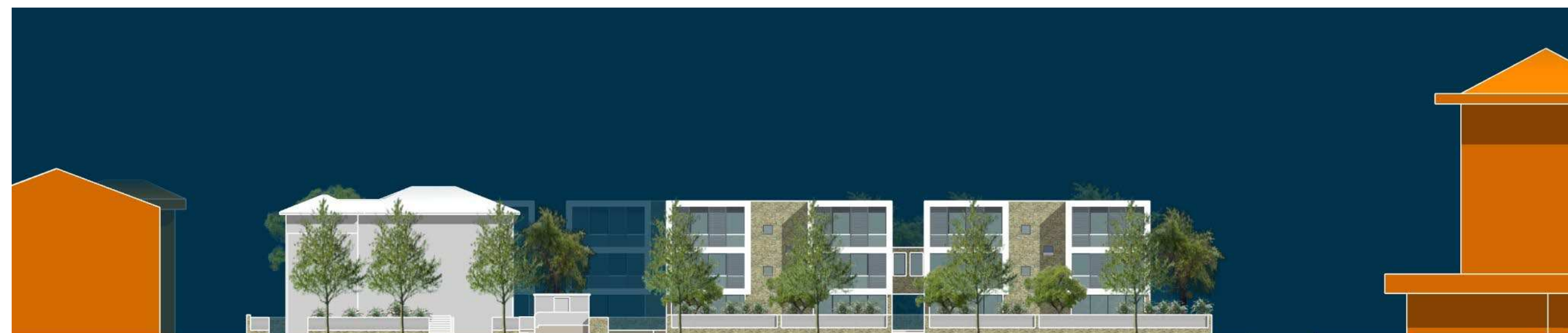
PROSPETTO DI PROGETTO SU VIALE DEI MILLE