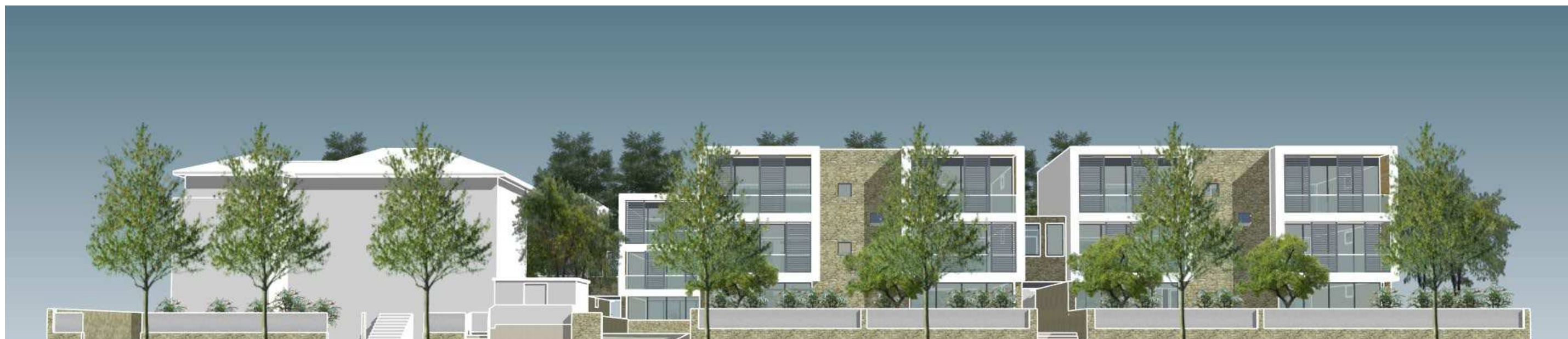
VISTA DA VIALE DEI MILLE