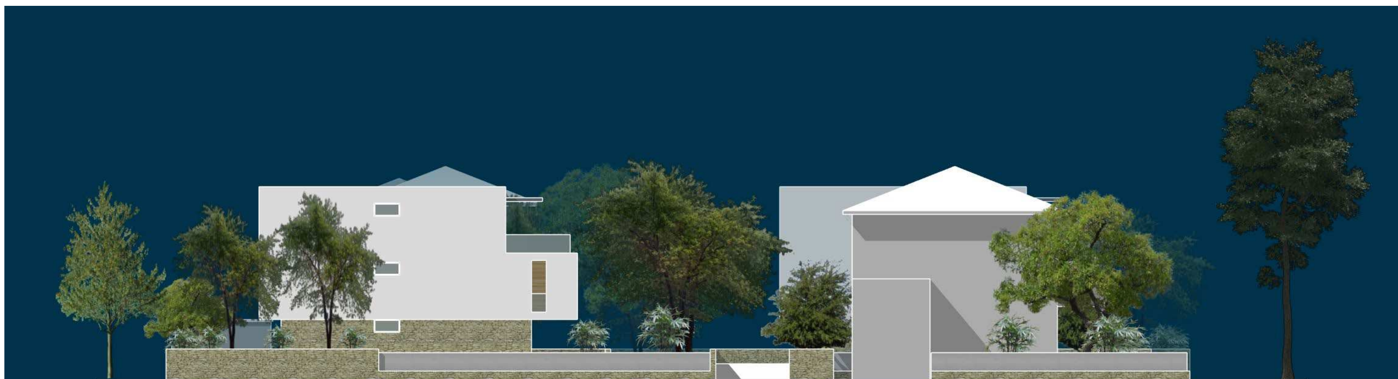
PROSPETTO DI PROGETTO SU VIALE MILANO