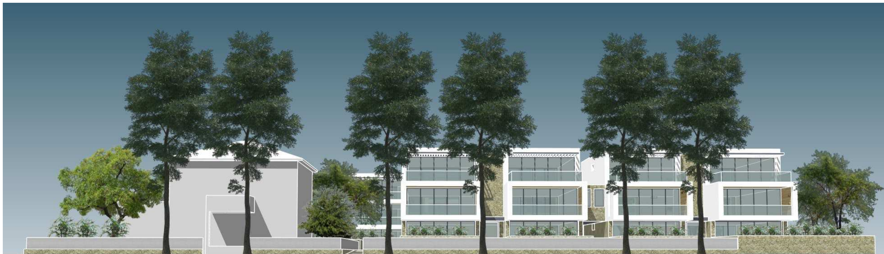
VISTA DA VIALE CARDUCCI