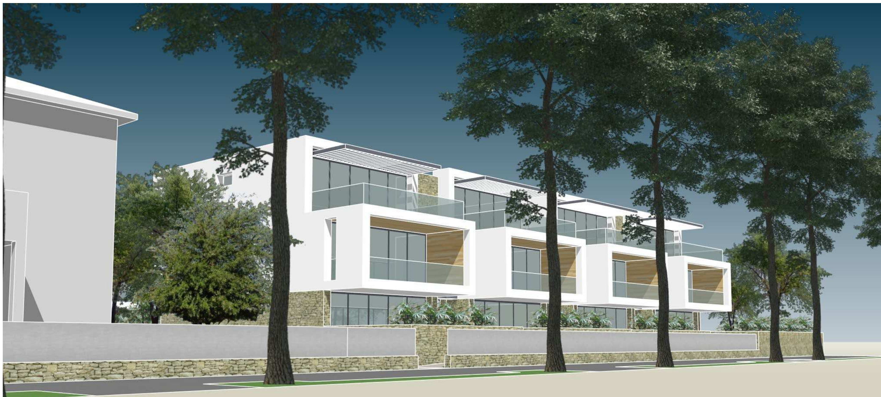
VISTA DA VIALE CARDUCCI