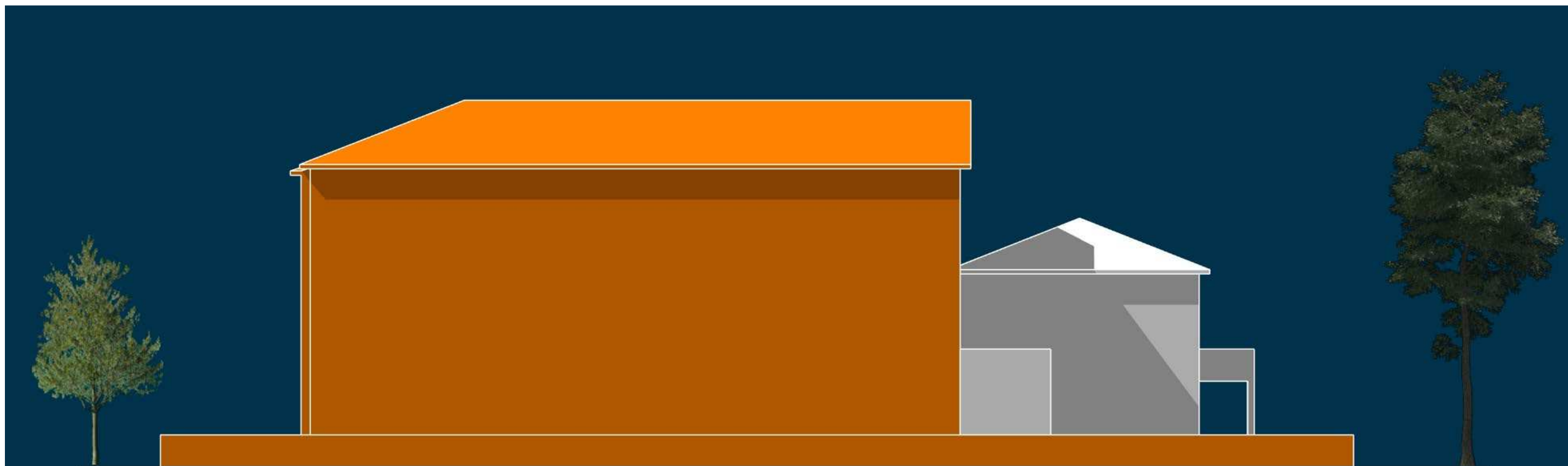
PROSPETTO ATTUALE VIALE MILANO